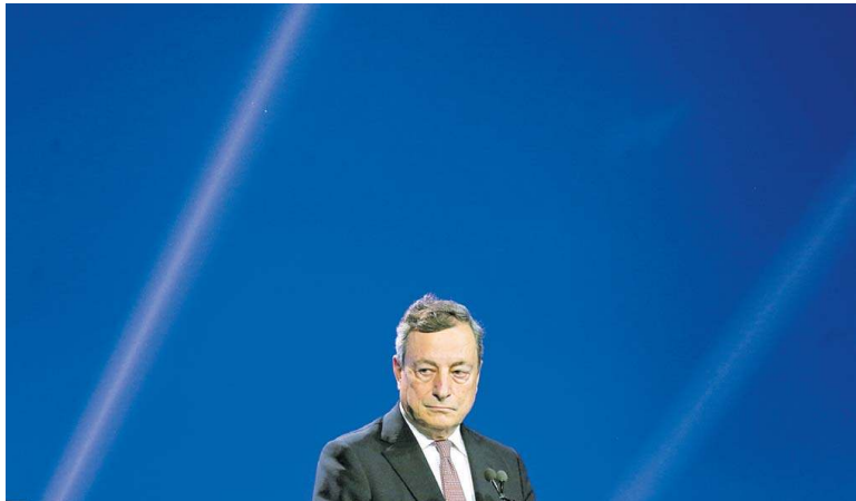
Einst war er bei der EZB für Europa zuständig, jetzt hat vor allem Italien im Blick: der römische Premierminister Mario Draghi.

Europa Das Wachstum ist zurück – aber auch die Inflation